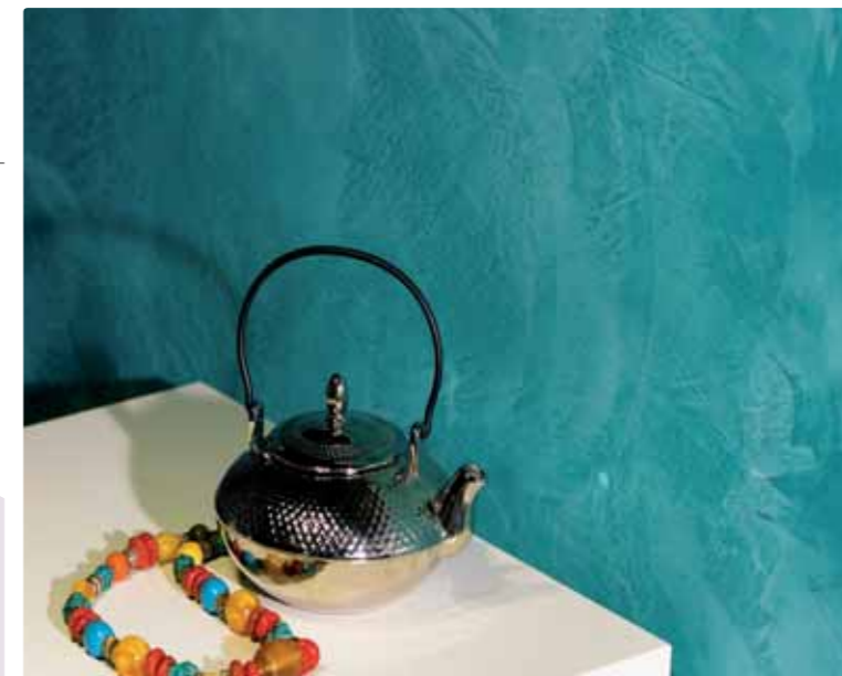
■ A destra parete con Tattoo RIFLESSI

è ottimo, si hanno soluzioni estetiche innovative, con effetti di