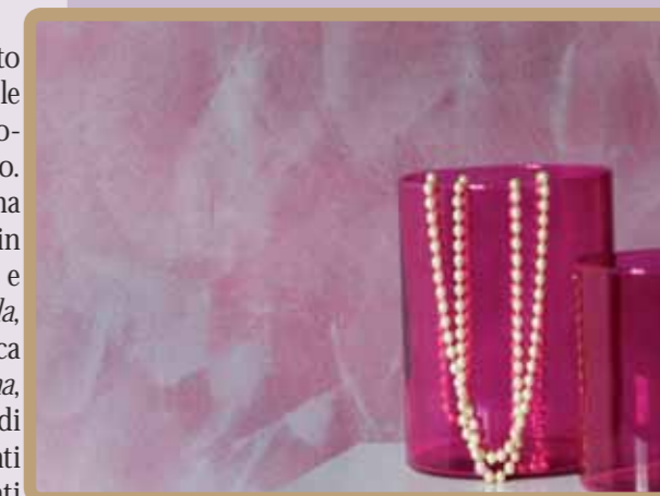
■ Parete con Tattoo TAHITI TWIN

layout design di Eleonora Diqattro testo di Simone Corami