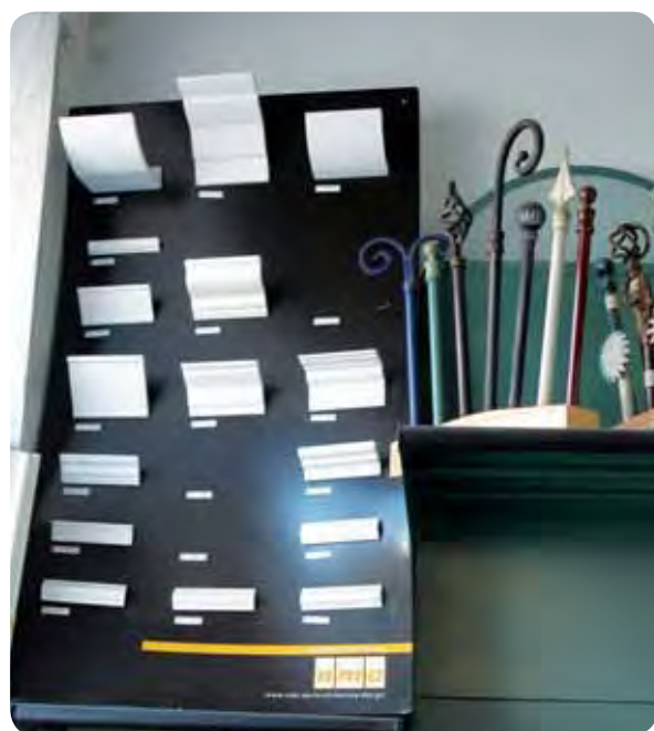
Espositore di prodotti NMC

Ma l'intero catalogo Coop.Ar non si esaurisce qui, anzi abbiamo molti altri marchi nel nostro registro fornitori con cui abbiamo accordi da anni. Parliamo di grandi aziende e produttori che si sono sempre distinti nelle loro categorie, come Henkel, Tillmans, Sait, Pennellificio 2000, Quantificio Senese, Mistral, Diadora e altri.