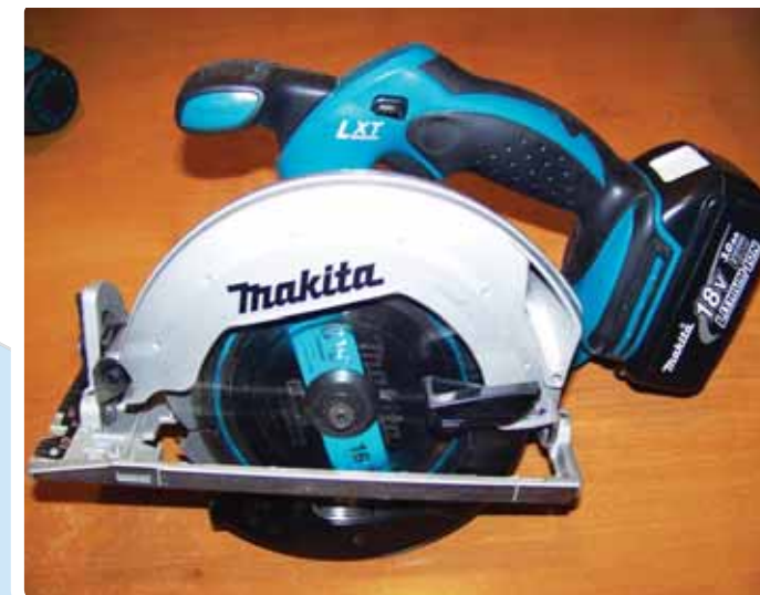
In alto e a sinistra di prodotti Machita

perché gli scenari futuri non fanno pensare all'ottimismo.