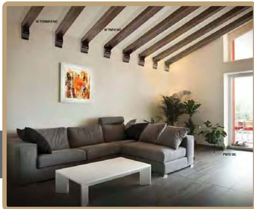
Ambiente realizzato con i prodotti di Bovelacci